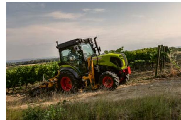
▲ Dank seiner Wespentaille und der kompakten Bauweise überzeugt der Traktor mit hoher Wendigkeit und guter Übersicht.