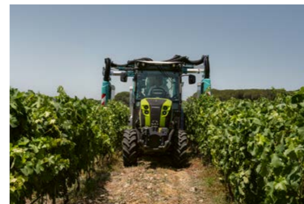
◀ Mit den vier Varianten S, M, L und XL passt sich der NEXOS 2 präzise Ihren Anbaubedingungen an.

Der NEXOS 2 ist HVO-kompatibel. Sie können ihn unbesorgt mit dem synthetischen Dieselmotorenstoff HVO betanken. Der Verbrauch ist der gleiche wie bei fossilem Diesel. Allerdings fallen die Schadstoff- und CO 2 -Emissionen bei HVO geringer aus, da z.B. Aromate oder schwefelhaltige Verbindungen fehlen.