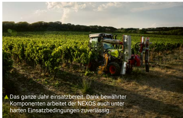
▲ Das ganze Jahr einsatzbereit. Dank bewährter Komponenten arbeitet der NEXOS auch unter harten Einsatzbedingungen zuverlässig.

▼ Eine Druckluftlanze befindet sich griffbereit unter der Motorhaube. Mit der langen Lanze und den auf 90° ausgerichteten Düsen reinigen Sie das Kühlerpaket effektiv bis in die letzten Ecken.