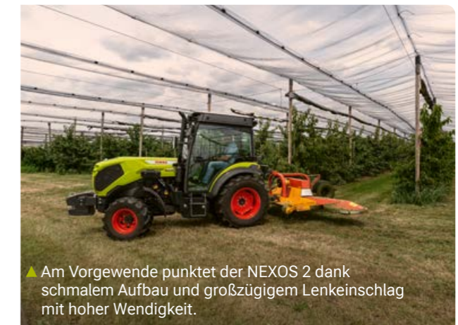
▲ Am Vorgewende punktet der NEXOS 2 dank schmalen Aufbau und großzügigem Lenkeinschlag mit hoher Wendigkeit.