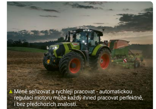
▲ Méně seřizovat a rychleji pracovat - automatickou regulací motoru může každý ihned pracovat perfektně, i bez předchozích znalostí.

▲ CMATIC nabízí tři rychlostní rozsahy s vlastními hodnotami tempomatu v obou směrech. Mezi těmito rozsahy můžete pohodlně přepínat stisknutím tlačítka během jízdy.