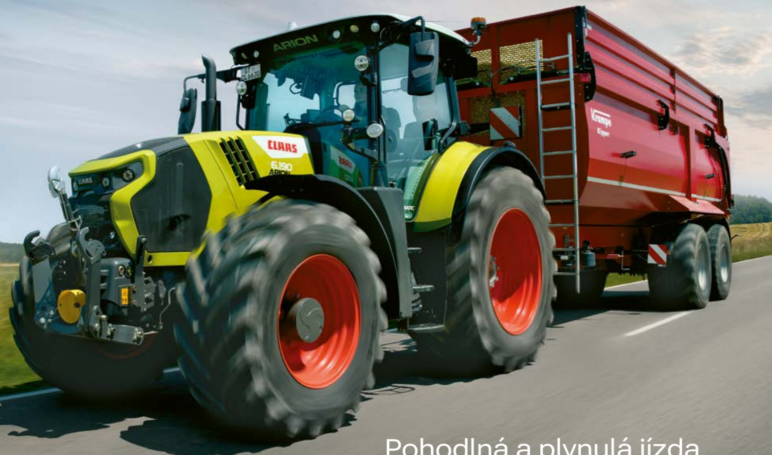
Pohodlná a plynulá jízda.