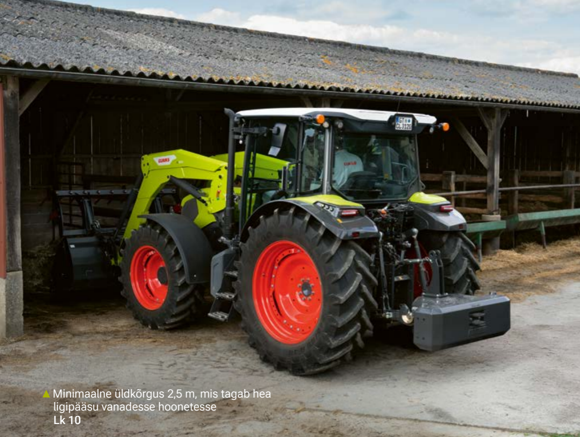
▲ Minimaalne üldkõrgus 2,5 m, mis tagab hea ligipääsu vanadesse hoonetesse Lk 10