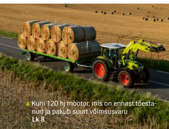
▲ Kuni 120 hj mootor, mis on ennast tõestanud ja pakub suurt võimsusvaru Lk 8

Pikad hooldusintervallid, kiire teenindus, õigeaegne varuosatarne ja MAXI CARE'i igakülgne kaitse: AXOS 3 avaldab muljet enda töökindlusega ja ühtlasi sobitub hooldusküsimustes põllumehe vajaduste järgi.