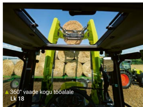
▲ 360° vaade kogu tööalale Lk 18