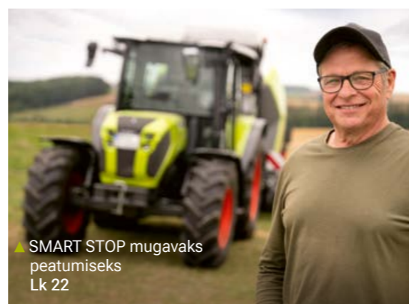
▲ SMART STOP mugavaks peatumiseks Lk 22