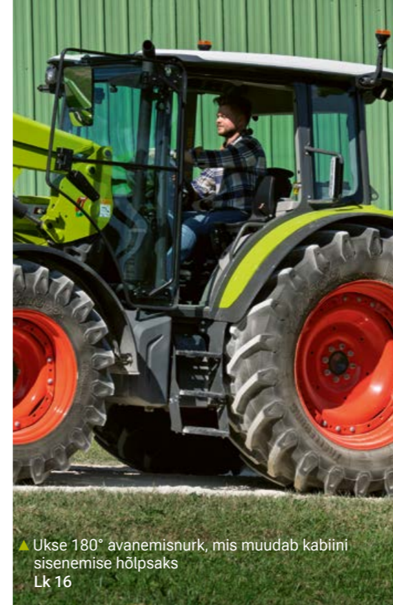
▲ Ukse 180° avanemismurk, mis muudab kabiini sisenemise hõlpsaks Lk 16