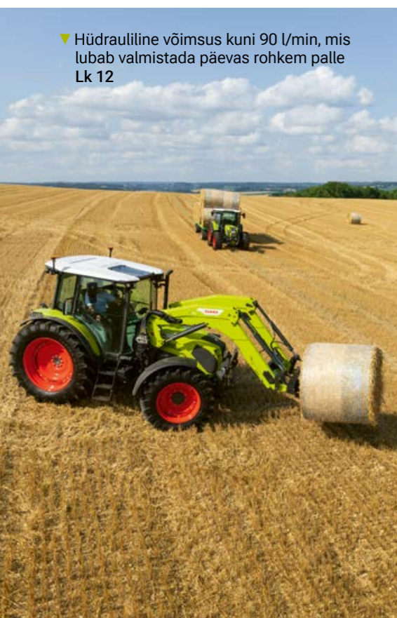
▼ Hüdrauliline võimsus kuni 90 l/min, mis lubab valmistada päevas rohkem palle Lk 12