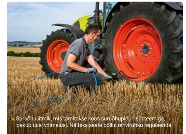
▲ Suruõhuliitmik, mis tarnitakse koos suruõhupiduri süsteemiga, pakub uusi võimalusi. Näiteks saate põllul rehvirõhku reguleerida.