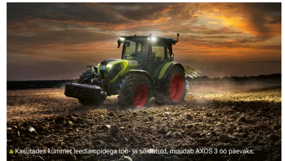
▲ Kasutades kümme leedlampidega töö- ja sõidutuld, muudab AXOS 3 öö päevaks.