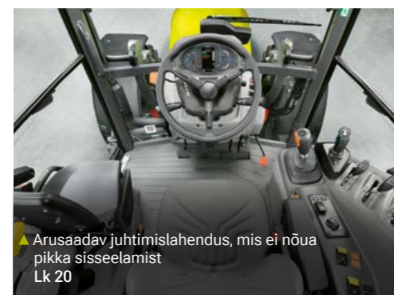
▲ Arusaadav juhtimislahendus, mis ei nõua pikka sisseelamist Lk 20