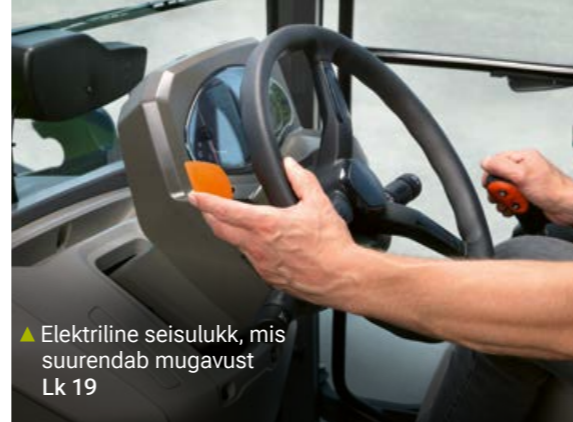
▲ Elektriline seisulukk, mis suurendab mugavust Lk 19