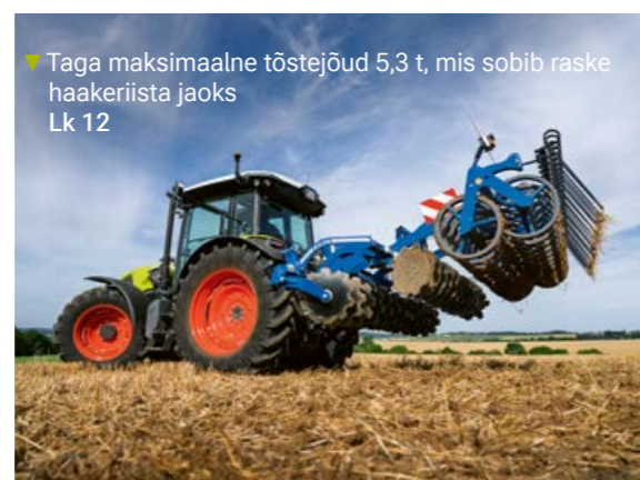
▼ Taga maksimaalne tõstejõud 5,3 t, mis sobib raske haakeriista jaoks Lk 12