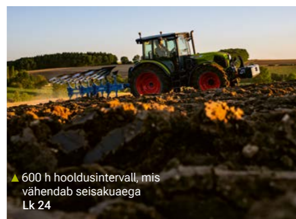
▲ 600 h hooldusintervall, mis vähendab seisakuaega Lk 24