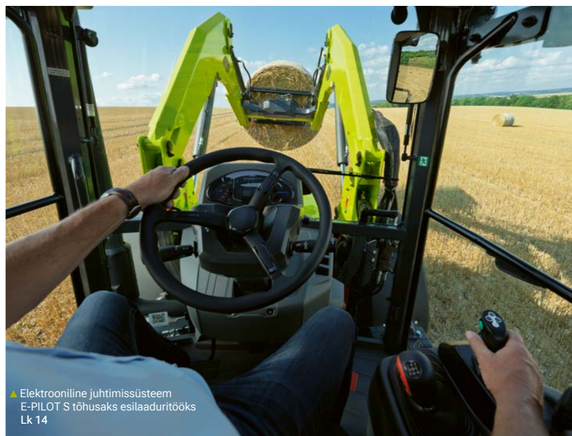
▲ Elektroniline juhtimissüsteem E-PILOT S tõhusaks esilaaduritööks Lk 14