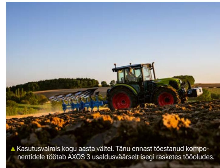
▲ Kasutusvalmis kogu aasta vältel. Tänu ennast tõestanud komponentidele töötab AXOS 3 usaldusväärset isegi rasketes tööoludes.