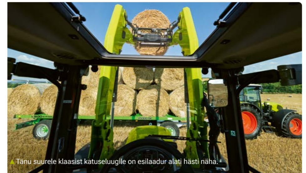
Tänu suurele klaasist katuseluugile on esilaadur alati hästi näha.