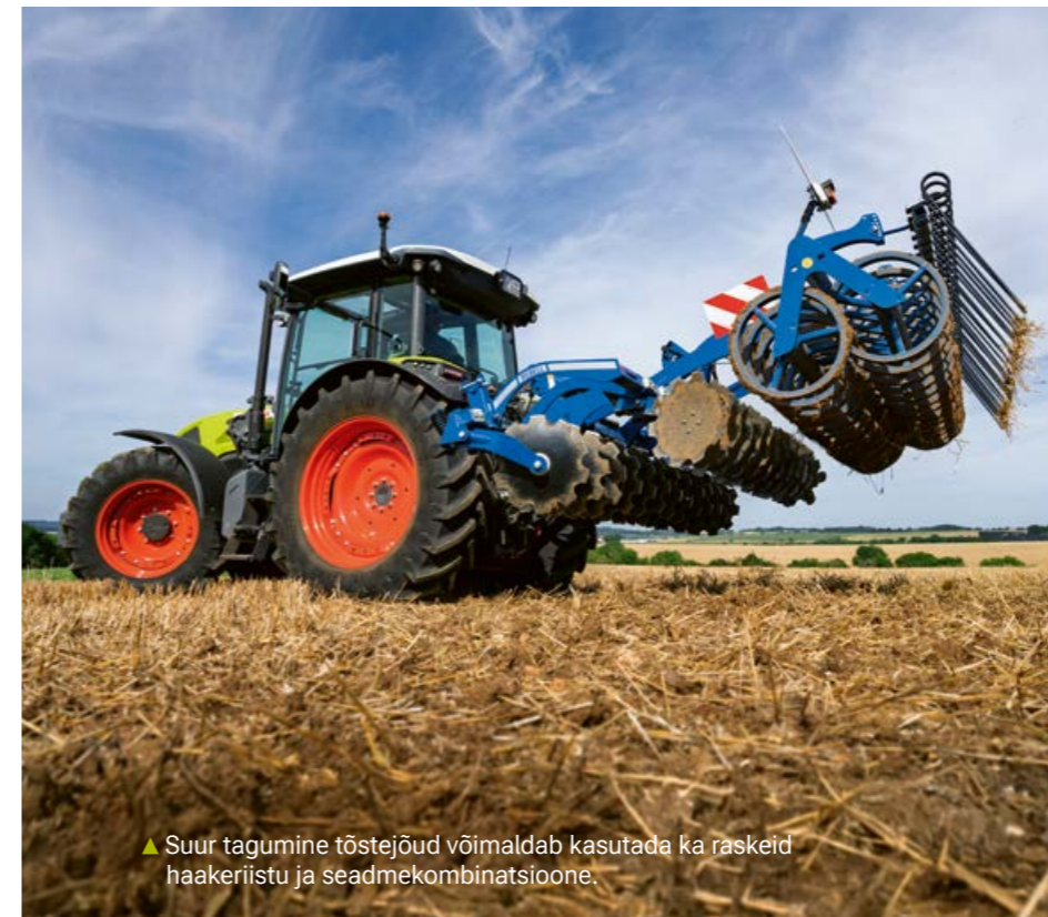
▲ Suur tagumine tõstejõud võimaldab kasutada ka raskeid haakeriistu ja seadmekombinatsioone.

AXOS 3 tagaosas on saadaval kolm jõuvõtuvõlli kiirust, sealhulgas 540 ECO jõuvõtuvõlli režiim, mis pakub vähendatud mootori pöörlemiskiirust. See kahandab kerge jõuvõtuvõlli töö korral diislikütuse kulu ja mürataset. Ka tagumist jõuvõtuvõlli saate mugavalt juhtida, vajutades tagumistel poritiibadel olevale nupule.