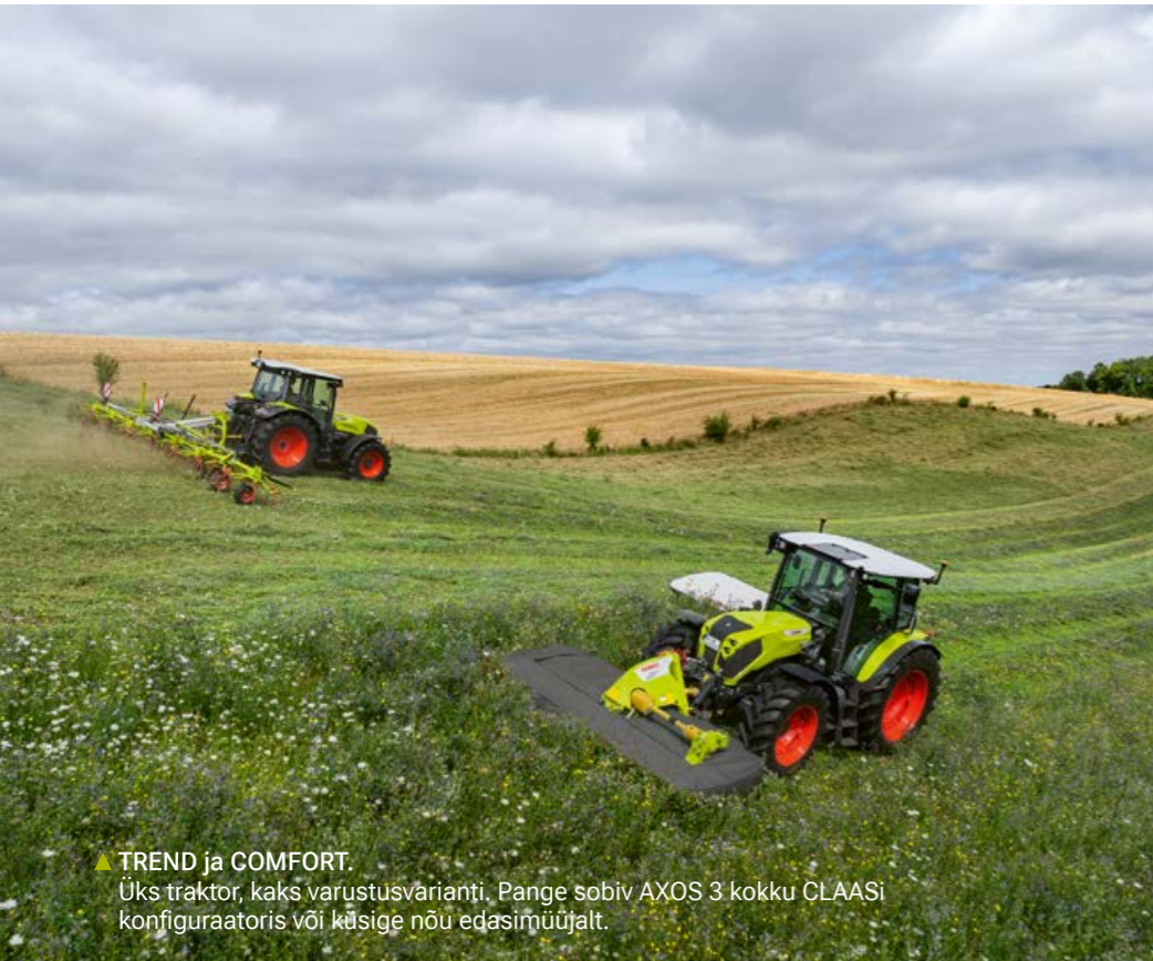
▲ TREND ja COMFORT. Üks traktor, kaks varustusvarianti. Pange sobiv AXOS 3 kokku CLAASI konfiguraatoris või küsige nõu edasimüüjalt.